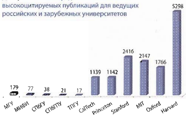
Диаграмма 1. Распределение показателя высокоцитируемых публикаций для ведущих российских и зарубежных университетов